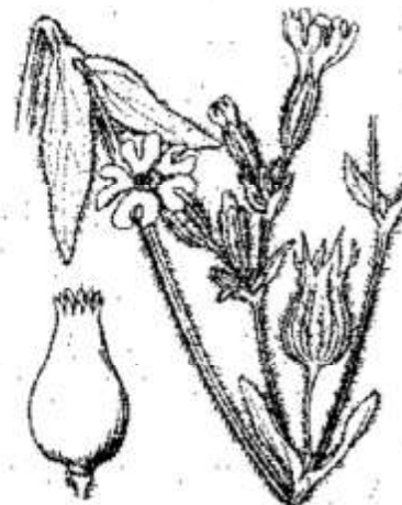
Lychnis vespertina .

Lieux cultivés et incultes, dans toute la France et en Corse. — Toute l'Europe; Asie occidentale; Afrique septentrionale. = Mai-juillet.