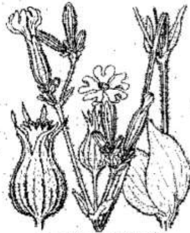
Lychnis macrocarpa .

Lieux cultivés et incultes, dans les Bouches-du-Rhône, l'Aude et les Pyrénées-Orientales. — Région méditerranéenne de l'Europe et de l'Afrique. = Avril-juin.