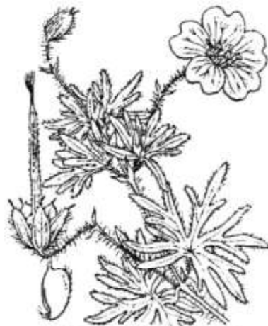
Geranium sanguineum .

Coteaux et bois secs, dans presque toute la France. — Europe, jusqu'à la région boréale; Asie occidentale. = Juin-juillet.