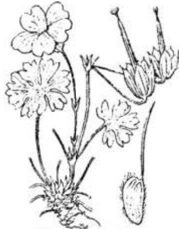
Geranium cinereum .

Pelouses et rochers élevés, dans les Pyrénées centrales et occidentales. — Espagne septentrionale; Italie centrale et méridionale. = Juin-août.