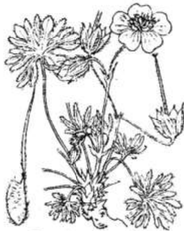
Geranium argenteum .

Fentes des rochers élevés, dans les Hautes-Alpes et les Basses-Alpes. — Italie; Frioul; Tyrol; Carniole; Carinthie. = Juin-juillet.